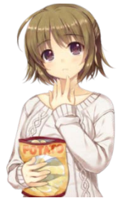
北野啓子 CV: 本多真梨子