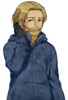
美樹本洋介 CV: 白熊寛嗣 フリーカメラマン。