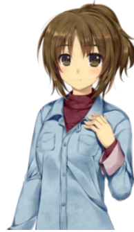
篠崎みどり CV: 仙台エリ 「シュプール」で アルバイトをして いる女性。