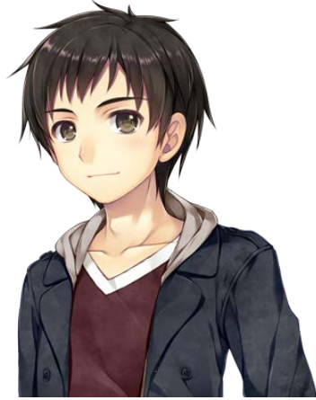
透 (とおる) CV: 逢坂良太 本作の主人公。大学生。 友人の真理とともにスキー にやって来た。