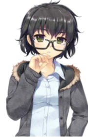
河村亜希 CV: 山本彩乃