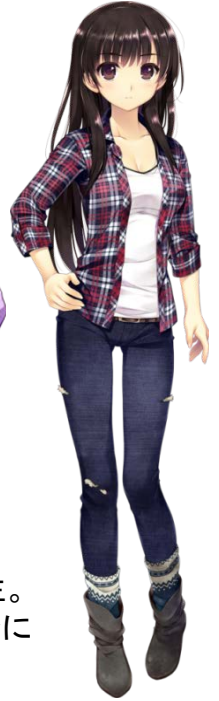
小林真理 CV: 明坂聡美 本作のヒロイン。 透と同じ大学に通う大学生。 叔父が経営するペンションに 透と共にやってきた。