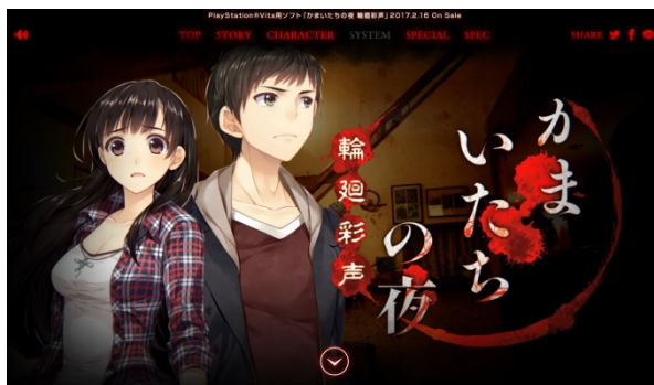
▲ゲーム公式サイトイメージ

公式サイトには、原作シナリオを担当した我孫子武丸氏と、新規シナリオを担当している竜騎士07氏のコメントを掲載しています。公式サイトにてぜひご覧ください。