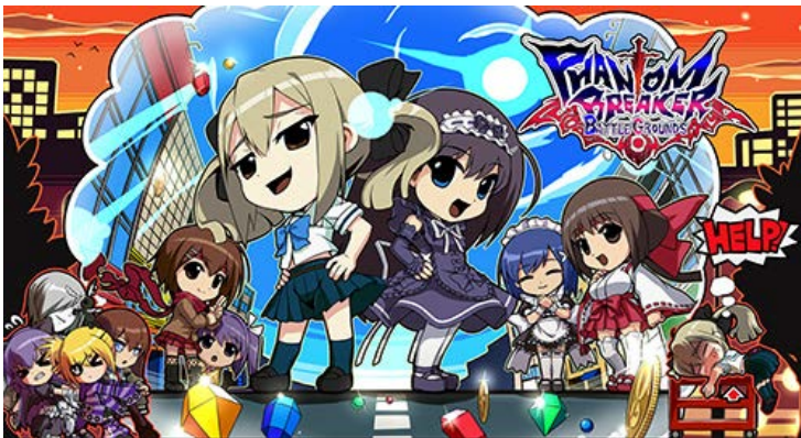
▲『ファントムブレイカー：バトルグラウンド』キービジュアル

『ファントムブレイカー：バトルグラウンド オーバードライブ』(PS4) 及び、『ファントムブレイカー：バトルグラウンド』(Xbox 360、PS Vita、Steam)は、レトロゲーム風のビジュアルやサウンドで好評の横スクロールラインバトルアクションゲームです。レトロ風でありながら、現在のゲーム機の性能を活かし、多人数同時プレイ、ネットワークプレイ可能で、多数の敵が登場し大乱戦を楽しめます。この2種の追加コンテンツを配信いたします。