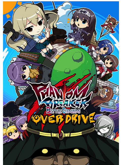
▲『ファントムブレイカー：バトルグラウンド オーバードライブ』キービジュアル