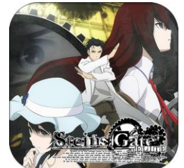
▲『STEINS;GATE』を全編アニメで再構築したフルアニメADVゲームの金字塔。『STEINS;GATE ELITE』