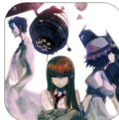
▲『STEINS;GATE』は、シリーズ累計100万本以上の販売実績を誇るADVゲームの金字塔。

是非この機会に、14年目に入る『STEINS;GATE』シリーズをお買い得価格でプレイしてください！