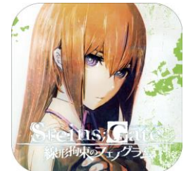
▲主人公・岡部倫太郎以外の視点でも描かれるシリアスなストーリー。各話完結の全10編で送る『STEINS;GATE 線形拘束のフェノグラム』

MAGES. ダウンロードゲームカタログ https://game.mages.co.jp/dl/