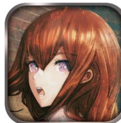
▲あつたかもしれない世界線!? ラブコメ路線で贈る、明るく弾けるシュタゲがここに！『STEINS;GATE 比翼恋理のだーりん』