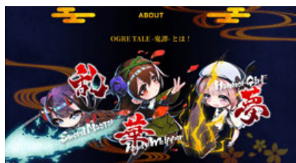
▲ゲーム紹介が続きます。