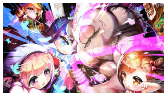
▲Steam版キービジュアル

Steam版は、日本語、英語、簡体中文、繁体中文に対応しています。音声は日本語のみです。