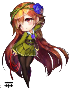
鬼ヶ島 華 CV. 武石あゆ実

プレイヤーキャラクター。 鬼ヶ島三姉妹の次女。日本刀の遣い手で、飛び道具として小刀も懐に忍ばせている。