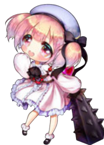
鬼ヶ島 夢 CV. 木野日菜