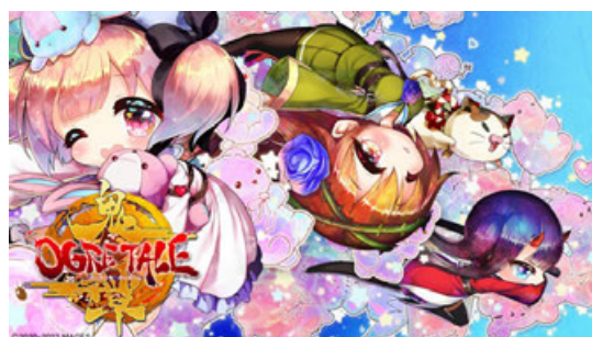
▲PS4版キービジュアル