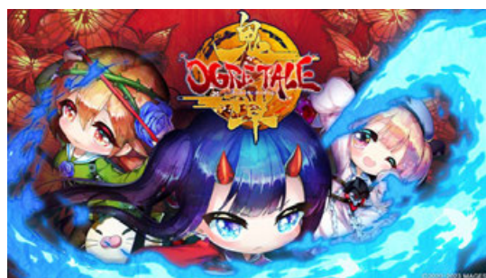
▲Switch版キービジュアル

コンシューマ版は、Nintendo Switch™、PlayStation®4、Xbox Series X|S、Xbox Oneでの発売となります。なお、ゲーム内のテキスト表示は日本語、英語の言語設定が可能です。音声は日本語のみとなります。