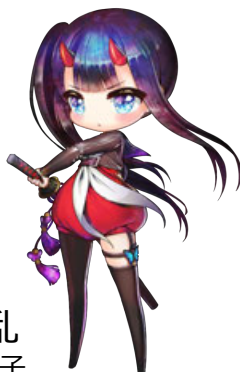
鬼ヶ島 乱 CV. 日笠陽子

プレイヤーキャラクター。 鬼ヶ島三姉妹の次女。日本刀の遣い手で、飛び道具として小刀も懐に忍ばせている。