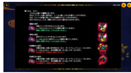
▲マニュアルには基本的な説明の他、各種アイテムの効果等も記載しています。

『OGRE TALE -鬼譚-』公式サイト https://game.mages.co.jp/ogretale/