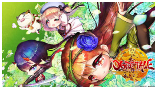
▲Xbox版キービジュアル