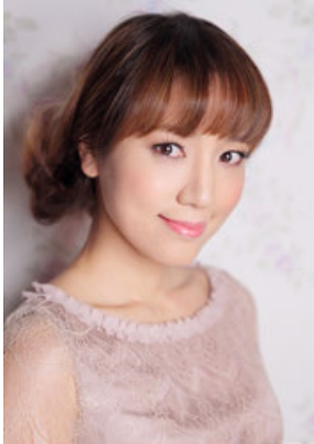
池澤春菜 (南つばめ役)