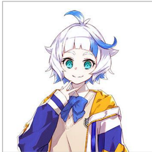
高梨 寝夢 (たかなし ねむ) CV:高橋 李依

本作の主人公。 青峰学園 高等部 1年3組。 若干注意力散漫でドジっ子。 黙っていれば美人。 曲がったことは許せない頑固な一面を持つ。