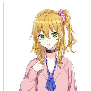
灰島 地球花 (はいじま あすか) CV:石飛 恵里花

青峰学園 中等部 1年A組。 ユウの妹。 子役アイドルでデビューし、最近徐々に仕事も増えている有望株。 兄のユウよりしっかりしている。