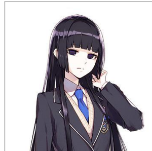
棺 まりあ (ひつぎ まりあ) CV:陶山 恵実里

青峰学園 高等部 1年3組。 YouTuber。 LEEDという事務所に所属し、芸能活動を行っているが イマイチ人気が出ないことに焦りを感じている。