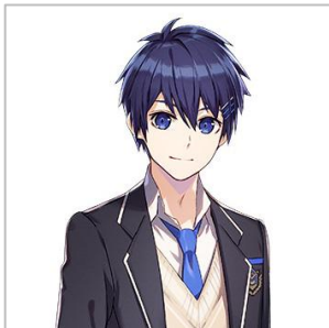
進藤 ユウ (しんどう ゆう) CV:菊地 燎

青峰学園 高等部 1年3組。 大人な言動が多く、冷静な性格。 オカルト方面に詳しい、ミステリアスな少女。