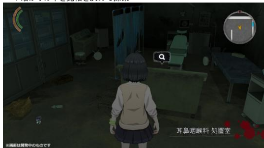
▼暗がりの中を覚悟を決めて探索