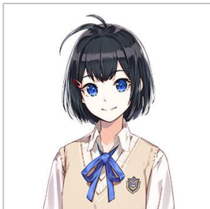
七海 遥 (ななみ はるか) CV:市ノ瀬 加那

本作の主人公。 青峰学園 高等部 1年3組。 若干注意力散漫でドジっ子。 黙っていれば美人。 曲がったことは許せない頑固な一面を持つ。