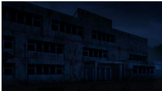
▼間に包まれた廃病院の外観