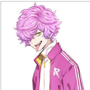
ロディー (ろでい) CV:小笠原 仁

青峰学園 高等部 1年3組。 ごく普通の高校生。 ルックスは良く、街を歩いていると 芸能関係者によくスカウトされる。 本人には全くその気はない。